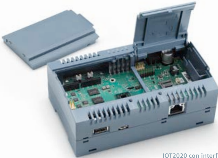
IOT200 con interfaz USB y Ethernet