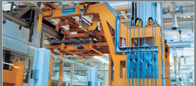
Einschienehängbahn als Beispiel einer IWLAN/RCoax-Anwendung