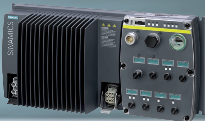
Der Sinamics G120D: Robust, flache Bauform mit einheitlichem Bohrbild über alle Gerätegrößen, Leistungsteil ohne Stopp der Automatisierung in kurzer Zeit tauschbar, umfassende Funktionalität bis hin zu „Safety Integrated“

Bewusst hat man beim Design des Sinamics G120D auf ein über alle Nennleistungen und Baugrößen hinweg einheitliches Bohrbild hingearbeitet. Es ist ja nun einmal so: Häufig wird bei der Auslegung der Antriebe deren Nennbelastbarkeit ausgereizt, um zu einem möglichst günstigen