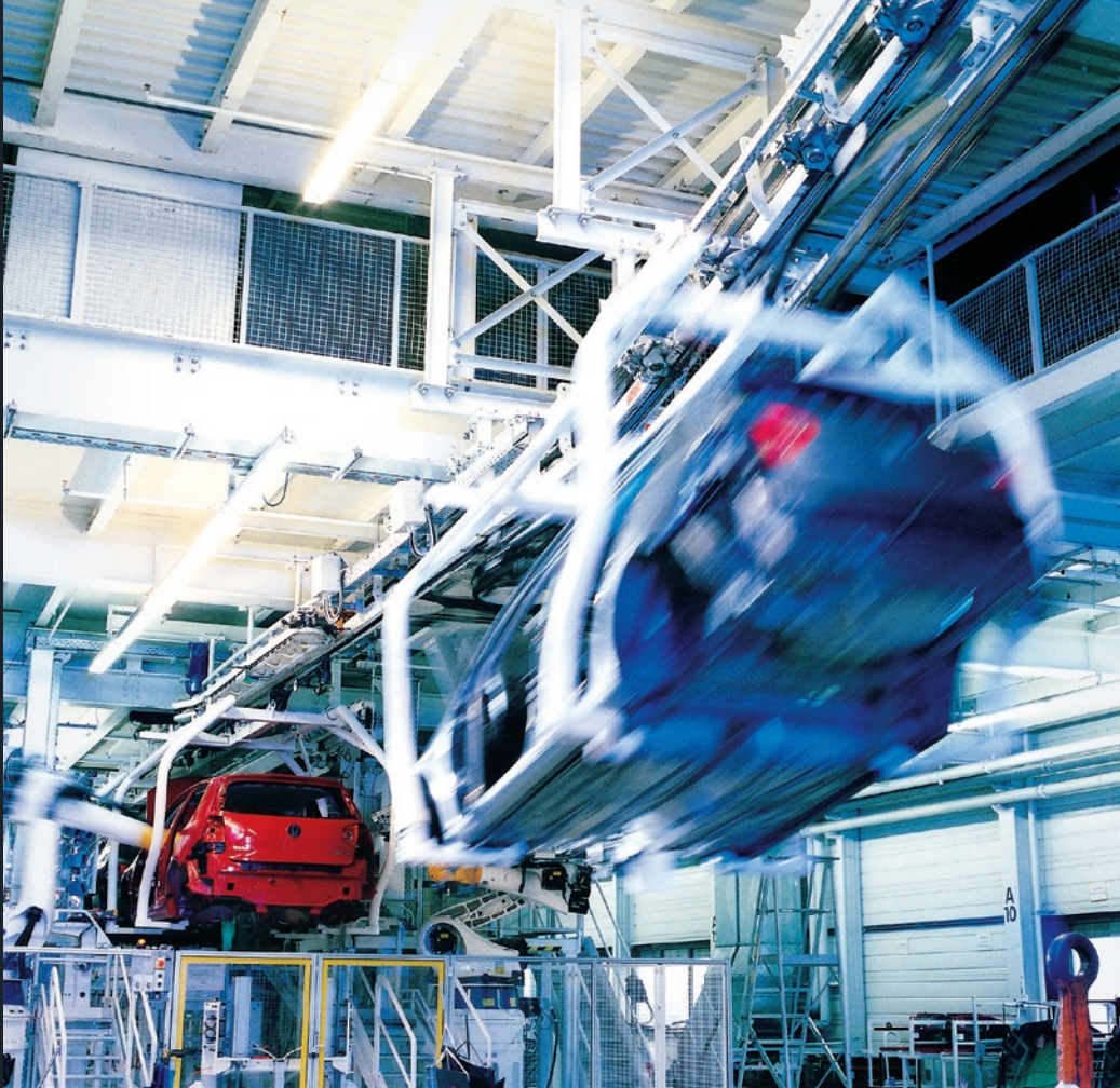
Hochverfügbare dezentrale Antriebe mit guten Engineering-, Installations- und Serviceeigenschaften und umfassendem Funktionsangebot vereinfachen das Realisieren anspruchsvoller Förderaufgaben.

gen Kosten-/Nutzenverhältnis zu kommen. Stellt sich dann im Probebetrieb heraus, dass man doch ein wenig mehr Leistung braucht, dann tut dies doppelt weh, wenn dazu der mechanische Aufbau geändert und nachträglich Bohrungen gesetzt werden müssen. Mit dem G120D ist diese Zwangslage entschärft. Selbst wenn beim Griff zur nächsten Leistungsstufe eine neue Baugröße fällig wird: Das leistungsstärkere Gerät passt auf die vorhandenen Befestigungslöcher. Dass ein einheitliches Bohrbild auch die Projektierung und das Erstellen der Konstruktionszeichnungen vereinfacht, versteht sich von selbst.