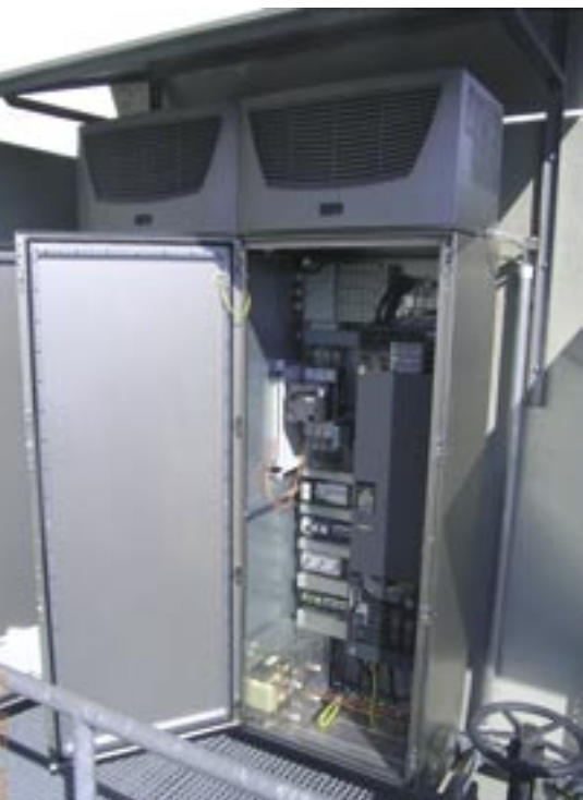
Bild 3: Frequenzumrichter reduzieren die Betriebskosten bei Shell in Ludwigshafen erheblich

gen aus der Planphase durch die Realität bestätigt und die Erwartungen sogar übertroffen. Die Amortisationszeit wird voraussichtlich nur 14 Monate betragen (Bild 2).